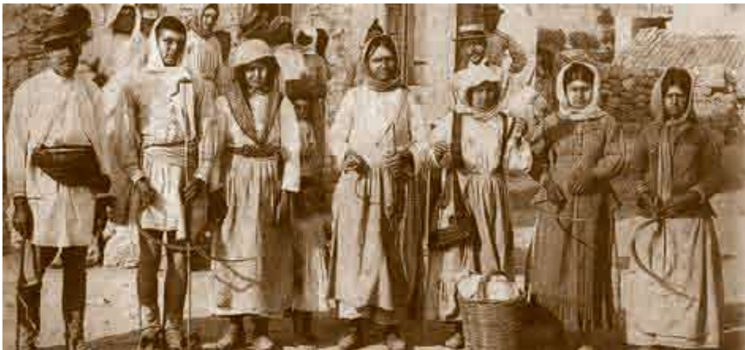
▲Καρτ ποστάλ με θεριστές στην Πελοπόννησο. Αρχές του 20ού αιώνα.